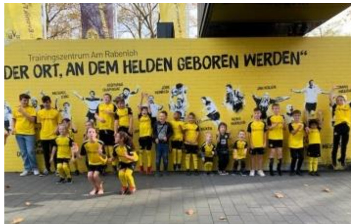
Es war ein erfolgreicher Ausflug für das Team "Diakids" aus Kirchen in Dortmund.